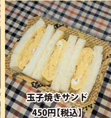
玉子焼きサンド 450円【税込】