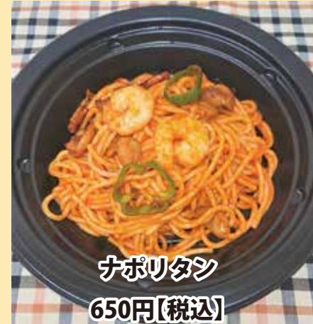
ナポリタン 650円【税込】

※いずれもお電話にて ご注文承ります。 ※テイクアウトメニューは 平日のみとなります。