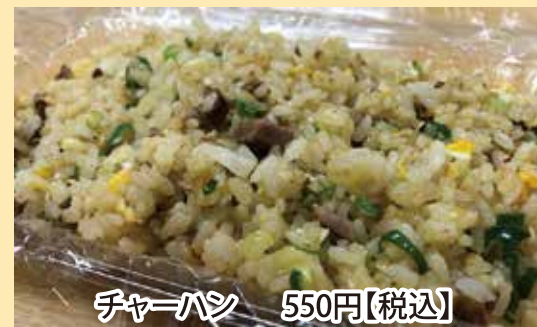
チャーハン 550円【税込】